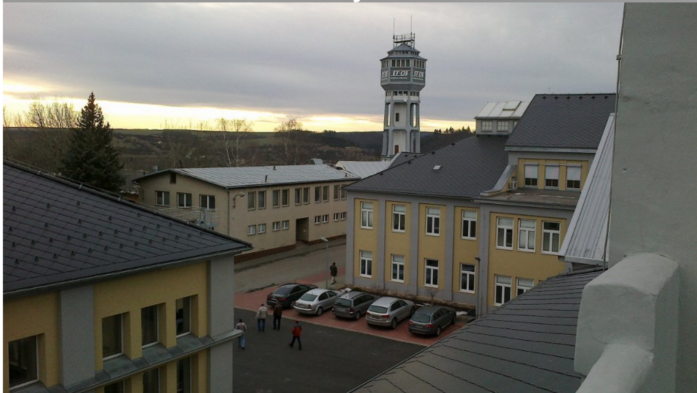
část zrekonstruovaného areálu KUKLA, Oslavany

Ve čtvrtek 31. 1. 2013 se konala valná hromada MAS Brána Brněnska. Uskutečnila se v areálu KUKLA v Oslavanech. Na jednání zazněly dvě pozitivní informace, které se týkají i nás, Čebíňáků. Byli jsme informováni, že byly úspěšné oba projekty, které jsme podávali jako partnerské projekty naší MAS Sdružení pro rozvoj Poličska, o.s. a Havlíčkův kraj, o.p.s. Jedná se o projekt „Hřbitovy- naše kamenná historie“ a „Technické školky“.