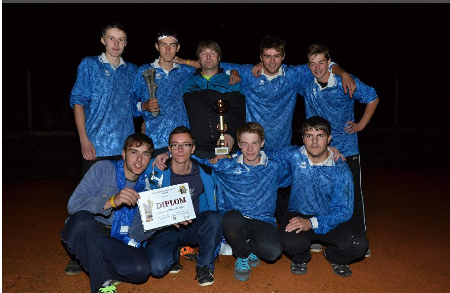
SDH Brumov, letošní vítězové nočních závodů O pohár starosty obce Čebín